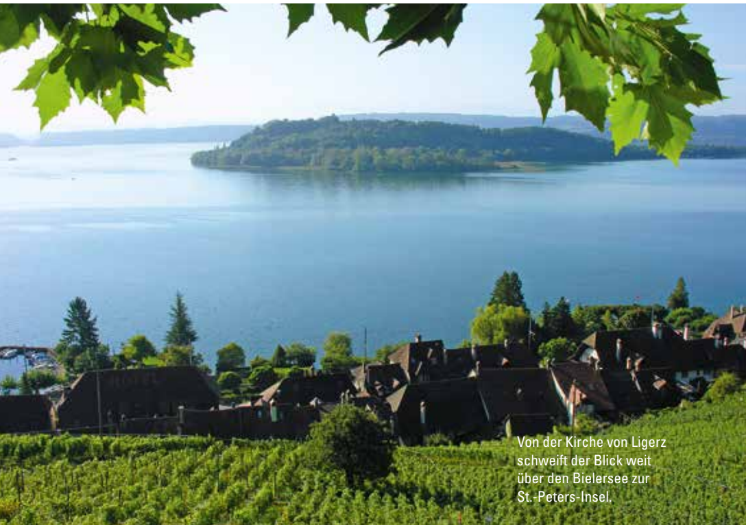
Von der Kirche von Ligerz schweift der Blick weit über den Bielersee zur St.-Peters-Insel.

ten Kurhaus-Waldweg, für die Romantischen den Abstieg durch die wilde Twannbachschlucht und für die philosophisch Bedächtigten den Gang auf dem Rebenweg mit dem weiten Blick über den Bielersee bis zu den Alpen. Und wer nicht die gesamte Wanderung durchführen will, hat zahlreiche Möglichkeiten zur Unterbrechung und nicht zuletzt zu einem Besuch in den Gasthäusern und Weinkellern von Twann und Ligerz.