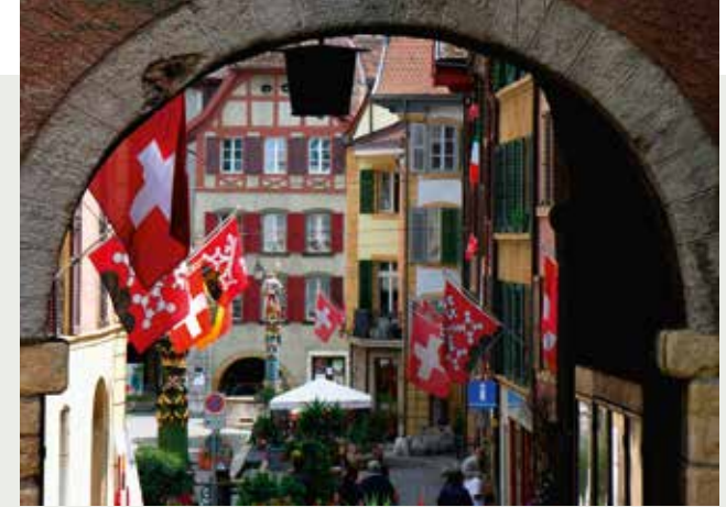
Blick in eine historische Gasse von La Neuveville.

– Von Biel via Gaicht zum Twannberg: Von der Talstation der Biel-Magglingen-Bahn gemäss