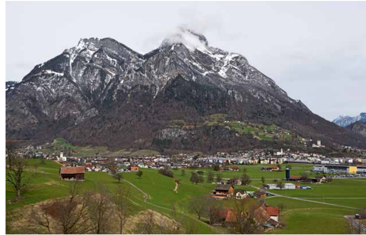
Das Städtchen Sargans und sein Schloss unter der Felswand des Gonzen. Nichts deutet darauf hin, wie durchlöchert der Berg ist.