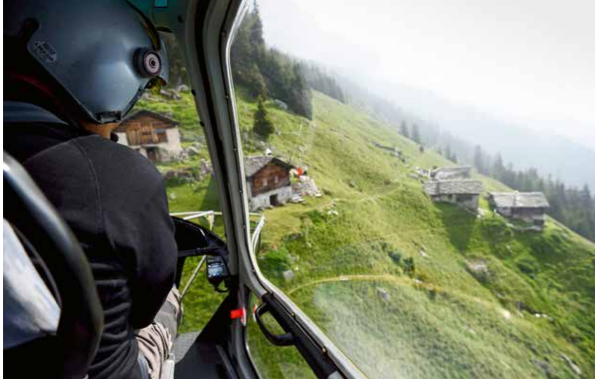
Im Anflug auf eine Maiensässsiedlung; die Versorgungsgüter werden sicher in einem Netz verpackt.